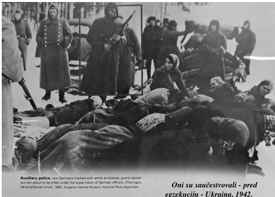
Auxiliary police , non-Germans marked with white armbands, guard Jewish women about to be killed under the supervision of German officers, Chernigov, Ukraine/Soviet Union, 1942.

Oni su saučestvovali - pred egzekuciju - Ukraina, 1942.