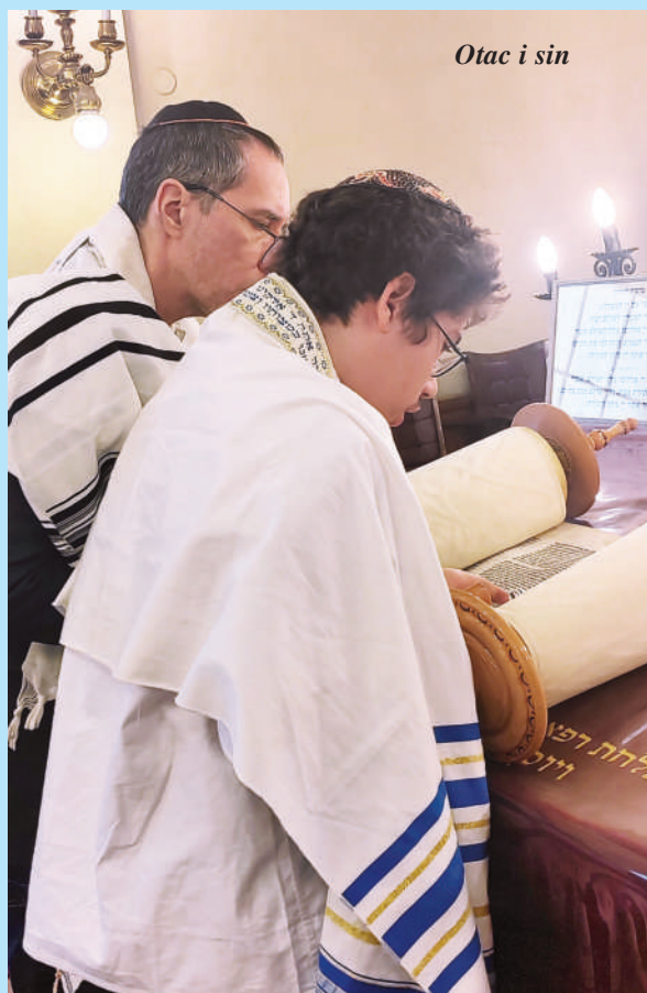
Otac i sin