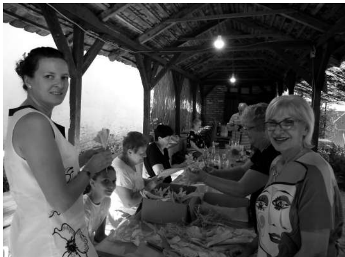
U regiji kojoj pripada i JO Subotica postojao običaj ukrašavanja sinagoge i domova Aškenazi Jevreja papirnim cvetovima i dekoracijama od urezanog papira