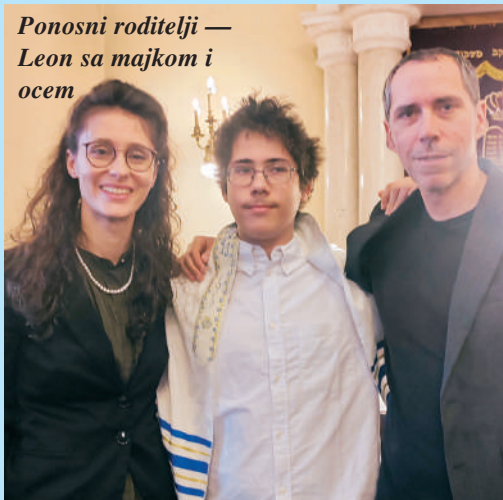
Vreme, u judaizmu, nije nešto što jednostavno prolazi. To je dar koji nam je stavljen u ruke