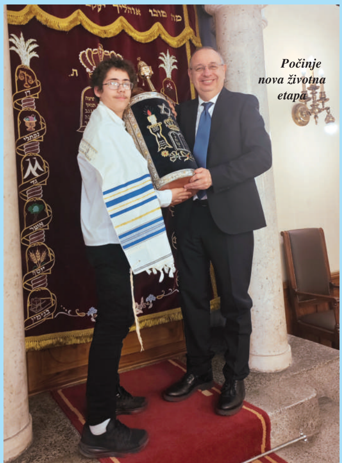
Počinje nova životna etapa