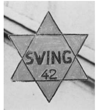
Papirna "falš" Davidova zvezda izrađena kao znak solidarnosti, jun 1942. Francuska

Ponižavanje Jevreja uz smeh - Beč, 1938.